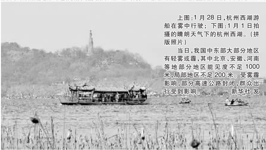
当日,我国中东部大部分地区有轻雾或霾,其中北京、安徽、河南等地部分地区能见度不足 1000 米,局部地区不足 200 米。受雾霾影响,部分高速公路封闭,群众出行受到影响。