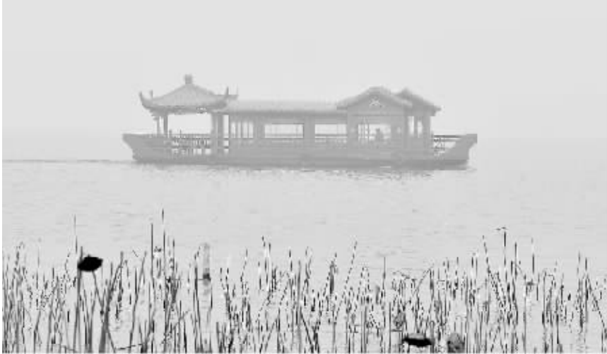
上图:1 月 28 日,杭州西湖游船在雾中行驶;下图:1 月 1 日拍摄的晴朗天气下的杭州西湖。(拼版照片)