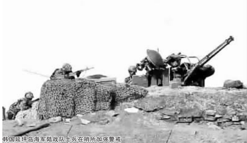
韩国延坪岛海军陆战队士兵在哨所加强警戒

韩国《朝鲜日报》报道,韩国最快将在本月重启修改《韩美原子能协定》谈判,首要目标是保障韩国提炼浓缩铀的权利。