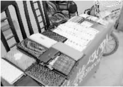
□晚报记者 朱东一 实习生 许坤朋 文/图

本报讯 昨日，记者在市区八一大道和七一路交叉口的交通指挥岗点看到，一张长桌上摆满了二代身份证、钱包、手提包等失物（如图），它们都是路人和清洁工捡到后交给这里的值勤交警的。 “每个月执勤交警都能收到身份证、钱包等失物。”七一路派出所交巡警大队副队长赵辉告诉记者，“前段时间数了数，光二代身份证就有 60 多张。二代身份证对市民非常重要，所