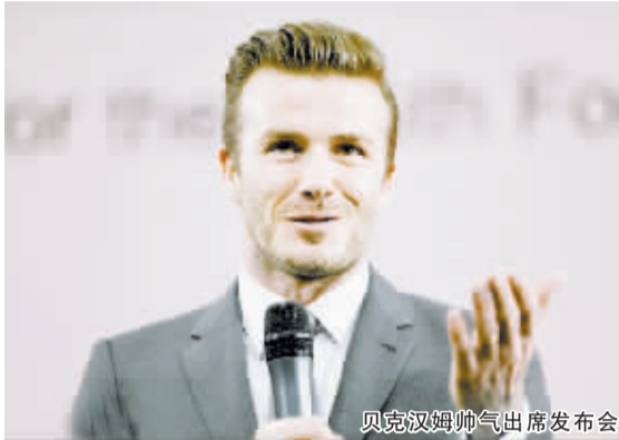
贝克汉姆帅气出席发布会