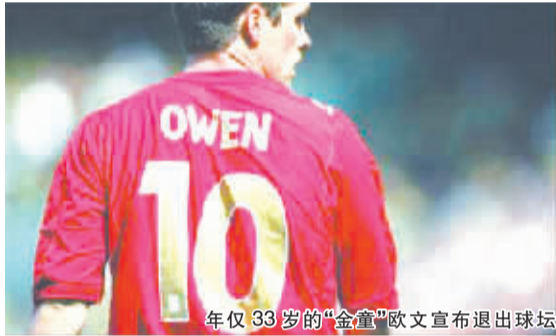
年仅 33 岁的“金童”欧文宣布退出球坛

本报综合消息 3 月 19 日下午,英格兰昔日“金童”欧文在个人网站上宣布将在本赛季结束后退役。这名 33 岁的射手去年 9 月初签约斯托克城后,仅在本赛季 30 轮英超比赛中出场 6 次,目前球队已决定不再与他续约,这让欧文作出了退役决定。