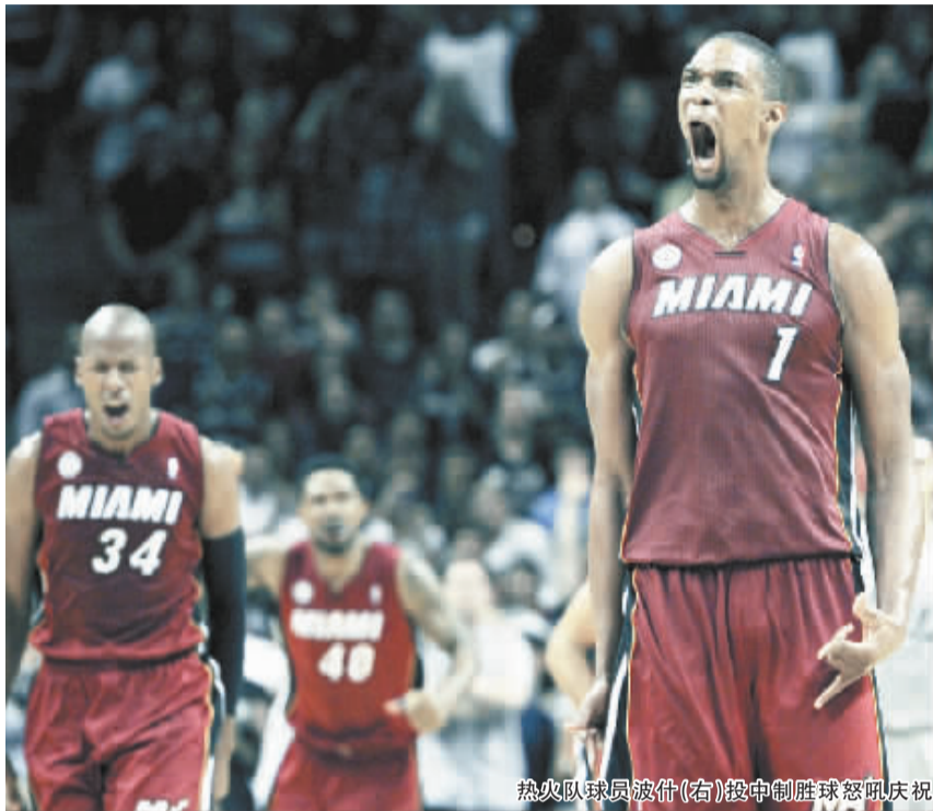
热火队球员波什(右)投中制胜球怒吼庆祝

科尔罚中两球后,邓肯这次投篮不中,给热火留下了11秒。热火没有叫暂停,马上发起攻击,终场前1.9秒,波什在中路接球,出手三分,应声命中,热火以88:86超出。帕克最后一投不中,马刺功亏一篑,本赛季两度败给热火。(吴俊)