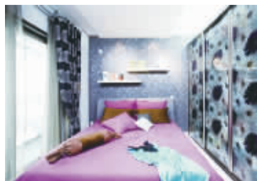
在床头放置错层隔板调和了深色空间的色彩

色彩较重的墙面空间除了用淡色系的软装饰品来中和色彩冲击力之外，在空出的墙面上放两道浅色隔板也能起到调节色彩的作用，另外，如果是在写字台等工作区的墙面放置隔板，还可以缓解写字台面的摆放压力，使桌面更加整洁。若是放在床头或者其他墙面，就可以放置一些家人的照片、生日礼物甚至是一盆清新的小绿植。