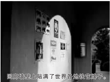
回廊墙壁上贴满了世界各地铁艺牌子。