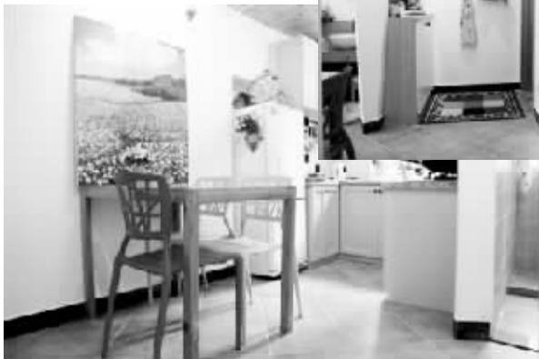
开放式厨房和小餐厅的装扮有让人放松的田园氛围。