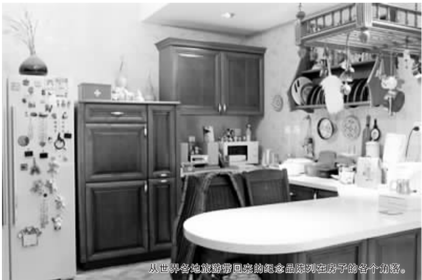
从世界各地旅游带回来的纪念品陈列在房子的各个角落。

相识 25 年、结婚 12 年的贝贝夫妻住在北京郊外一个小房子里。穿过贴满世界各地铁艺牌子的回廊,门口挂着一个木头牌子“Old Bear and His Little Honey Lives Here”(老熊和他的小蜜糖住在这里)。让人觉得这里像童话里的森林小屋一样,藏着无数秘密和趣味。