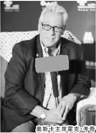
奥斯卡主席霍克·考奇