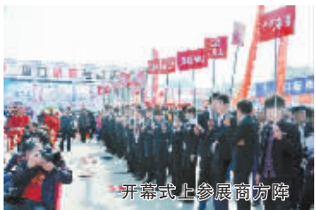
开幕式上参展商方阵