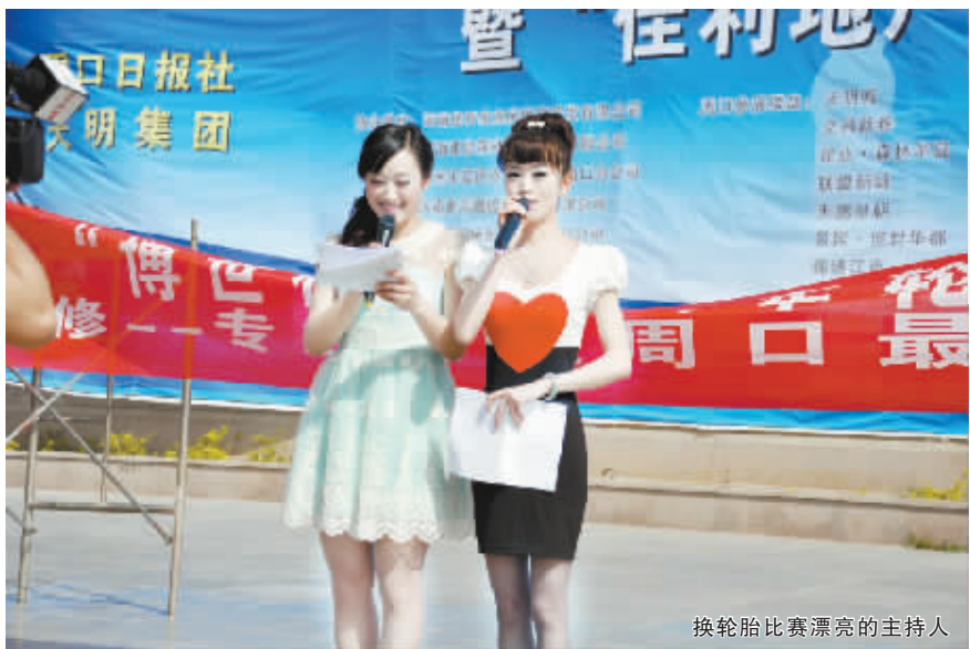
换轮胎比赛漂亮的主持人