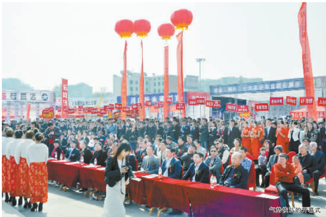
气势恢弘的开幕式