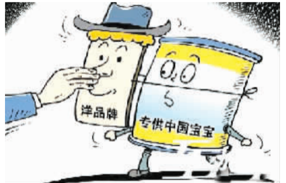
自称“洋奶粉”须经外交途径确认