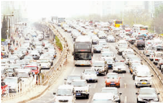
私家车取消15年报废“生死线”