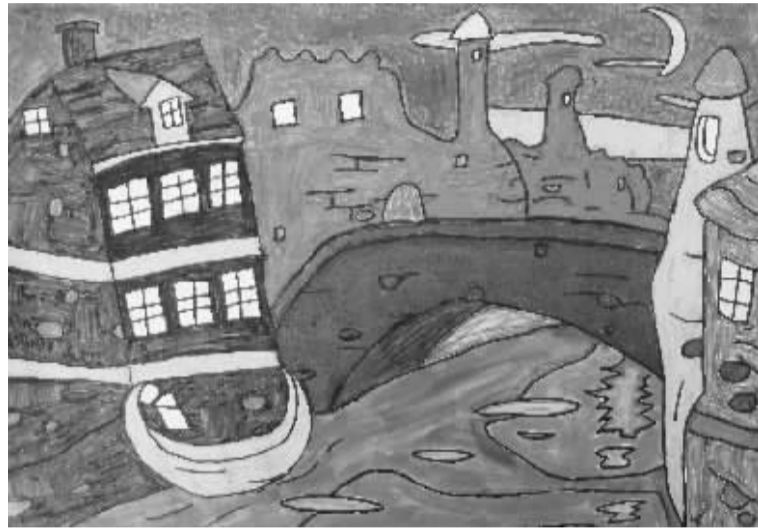
《夜色》 六(2)班 马浩宇 编号:132235 辅导老师:崔丹丹