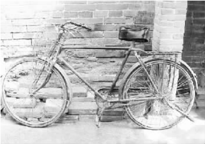
以前,这样的自行车可是一件宝贝。(资料图片)