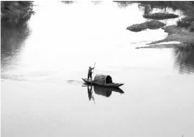
以前,这样的场景在河面上很常见。(资料图片)