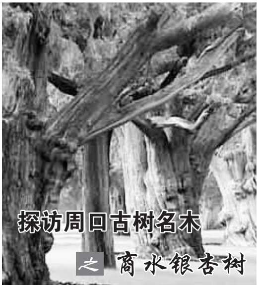
探访周回古树名木

传说多年前,有一个盲人听说夏庄银杏树非常粗,可他不知道其粗细程度,就想亲自测量一下。有一天,他经过此树,就把自己探路用的棍子放在树旁作为标记,然后张开手臂测量,一搂、二搂、三搂……在他用搂丈量树的时候,在附近玩耍的几个孩子把他的棍子拿到了一边,而盲人由于没有发现棍子被人拿走,就一个劲地用搂量下去,等他量到 72 搂的时候,几个调皮的孩子才不声不响地把棍子放回原处。“乖乖,这棵树真粗呀,竟然有 72 搂。”盲人摸到自己的棍子后,不由感慨。后来,这个盲人走到哪儿,都不忘记向人夸赞夏庄银杏树有 72 搂之粗,夏庄银杏树因此更加闻名。