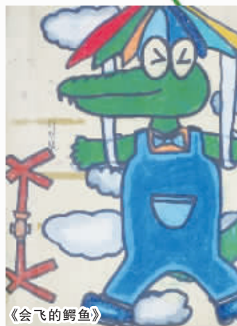
周口六一路小学五(7)班 刘明晓 编号:131347 (辅导老师:刘芝)