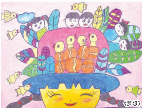
周口市莲花路小学六(1)班 徐依诺 编号:132231