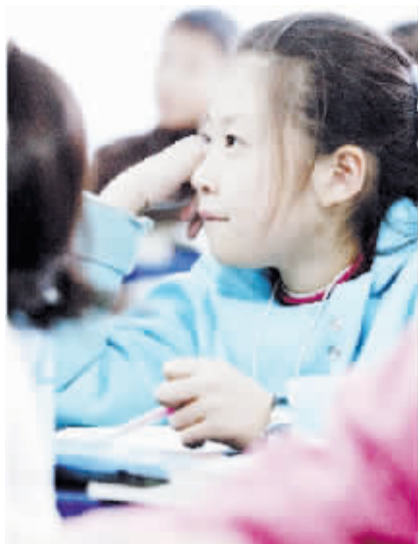
育过程中应有张有弛,松紧有度,并给予孩子足够的自由活动的空间和空间,使孩子在玩中求学、在学中能玩,如此,才能收到良好的教育效果。(贾娜)

其次,还需要有正确的教育方法。特长教育不同于学校教育的地方,在于它主要是培养孩子对某些技能学习的兴趣和求知欲望。因而在教