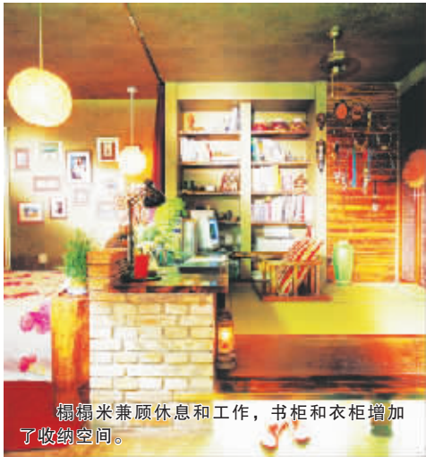
榻榻米兼顾休息和工作,书柜和衣柜增加了收纳空间。