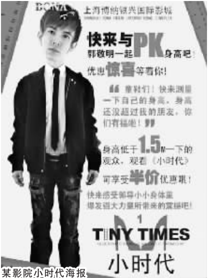
某影院小时代海报

此前,主办方在微博上向网友征集了“想听的歌”。主办方最大限度综合了大多数歌迷的意见,本次几位歌手也预先曝光部分曲目,每位巨星的经典歌曲皆榜上有名,并精选了多首经典歌曲准备与大家全场大合唱。《暗香》《love warrior 战》《相信自己》《beautiful day》《相见恨晚》《你把我灌醉》《走钢索的人》等,都是网友们呼声最高的歌曲。除了这些经典歌曲都将被唱响外,为了纪念邓丽君,黄绮珊还将演唱其经典歌曲《世界多美丽》,歌迷们也将有幸聆听沙宝亮的《正能量》,这些歌曲不仅涵盖 60 后、70 后年代,也深受 80、90 后喜爱,不论观众处在什么年龄,相信都能在本次演唱会上听到令自己心动的旋律。不过人气歌神杨宗纬所演唱的曲目,主办方却秘而不宣,成为演唱会的一个悬念,歌迷们将会在演唱会上听到 30 首左右经典歌曲。(张艳)