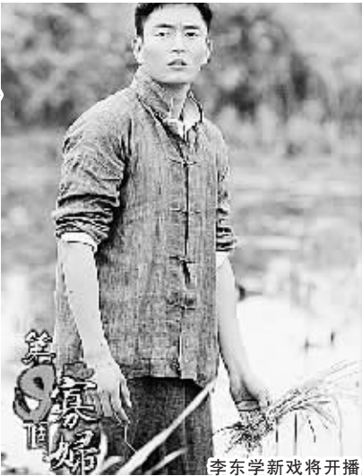
李东学新戏将开播

拍完《甄嬛传》之后,李东学有半年没有接戏。他不讳言在《甄嬛传》后接到的剧本多了很多,但自己的挑戏口味被磨刁了些。“说实话,我很期待有一个剧本能让我有‘叮’的一下的感觉,就像一见钟情那样。”后来,《第九个寡妇》找上来,李东学在拿到剧本的当晚,一口气看了十几集,凌晨三点半,他给经纪人打电话,“我想演!”拍完《第九个寡妇》已经一年多了,但李东学回忆起这部戏的种种还是记忆犹新。“《甄嬛传》之后,我努力把‘果郡王’倒空,好去迎接下一个角色。”可以说拍《第九个寡妇》时,李东学把自己这半年来的积攒的想法、“充电”后的精力,悉数投在了