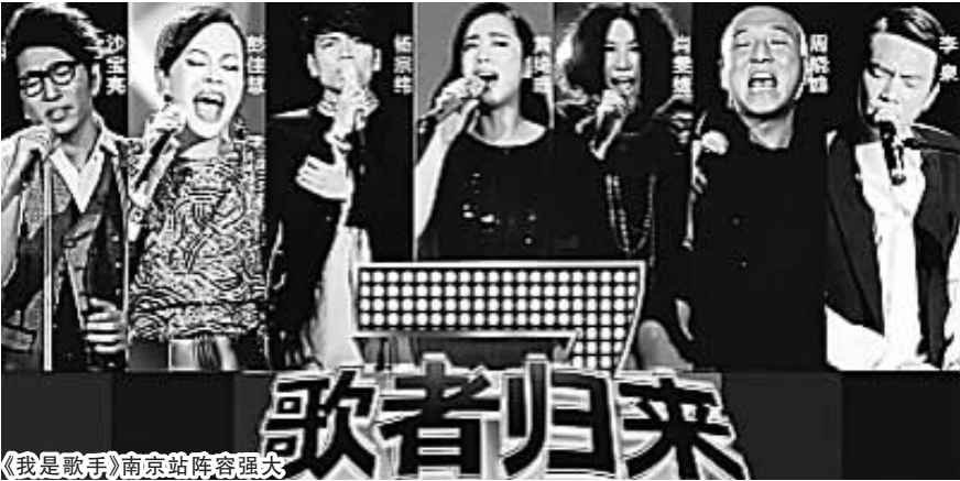
《我是歌手》南京站阵容强大

目前“歌者归来”演唱会南京站 177 元低价门票已经售罄,其他价位门票也所剩无几。主办方向歌迷公布了演出的四大看点——看点一:众星云集神秘嘉宾引猜想。除了老牌天后地位不可撼动的黄绮珊、彭佳慧、辛晓琪、新锐歌后尚雯婕、浪漫歌神杨宗纬、歌坛老炮沙宝亮、周晓鸥,还有当下歌坛风云人物担任神秘嘉宾,可谓众星云集,星光熠熠。看点二:巨幕舞台美轮美奂。主办方为演出配置了最先进的舞台搭建、灯光音响等硬件,搭建 24 米跨度的舞台顶棚,现场观众将会看到比一般商业性