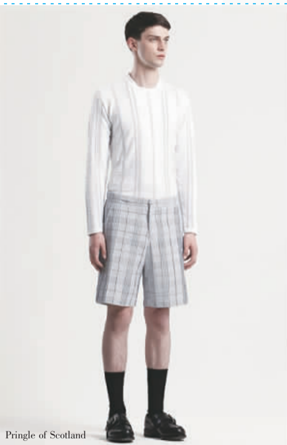
Pringle of Scotland

“好的东西并不是那些仅仅在某一季昙花一现的,好东西本身就具有生命力,能够持续足够的时间。”