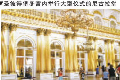
▼圣彼得堡冬宫内举行大型仪式的尼古拉堂

气魄和规模同样令人吃惊。所有建筑物,是在不同时代、不同建筑师用不同风格建造的,但却非常和谐。最具代表性的是为纪念战胜拿破仑,在广场中央竖立的、高大的亚历山大纪念柱,高47.5米,直径4米,重600吨,用整块花岗石制成,不用任何支撑,只靠自身重量屹立在基石上,它的顶尖上是手持十字架的天使,天使双脚踩着一蛇,这是战胜敌人的象征。