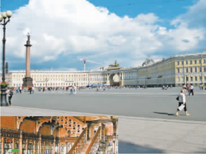
▲俄罗斯圣彼得堡冬宫广场