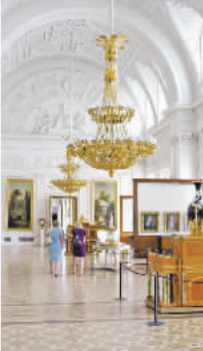
(黎存根) ▲俄罗斯圣彼得堡冬宫内的装饰

气魄和规模同样令人吃惊。所有建筑物,是在不同时代、不同建筑师用不同风格建造的,但却非常和谐。最具代表性的是为纪念战胜拿破仑,在广场中央竖立的、高大的亚历山大纪念柱,高47.5米,直径4米,重600吨,用整块花岗石制成,不用任何支撑,只靠自身重量屹立在基石上,它的顶尖上是手持十字架的天使,天使双脚踩着一蛇,这是战胜敌人的象征。