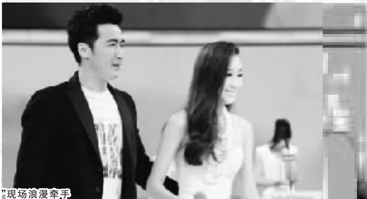
“非诚”现场浪漫牵手