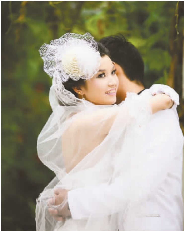
► 拍摄主题:幸福 拍摄地点:旗开影楼外景地 拍摄时间:2013 年 8 月