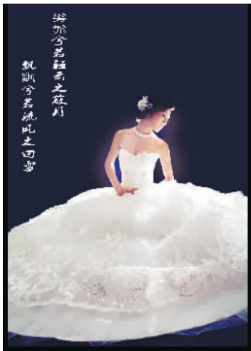
▲ 拍摄主题:寻梦 拍摄地点:旗开影楼影棚 拍摄时间:2013 年 7 月

周口日报报业集团 周口市艺术摄影学会 主办 周口晚报 周口豫东集团好莱坞影视城 协办