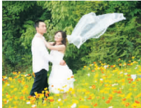
▲ 拍摄主题:拥抱爱情 拍摄地点:上海滩花园 拍摄时间:2013 年 8 月 7 日