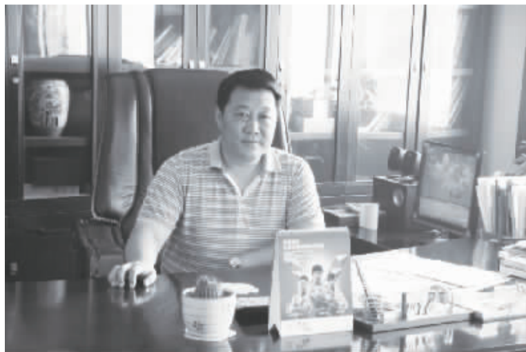
□记者 乔乔 文/图

周口中瑞汽车销售服务有限公司(以下简称周口中瑞)是上汽通用五菱在周口市授权的唯一一级经销商,下辖川汇区及各县市10个网点,公司专营五菱汽车(产品有:五菱宏光S、五菱宏光、五菱荣光、五菱荣光加长版、五菱之光、五菱货车、五菱专用车等)。公司致力于为客户创造价值,让客户满意的目标,一直不断探索创新。