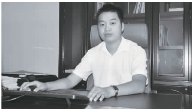
□记者 戚团结 文/图

周口亿顺汽车销售服务有限公司成立于2008年,位于周口市太昊路西,公司占地面积5528平方米,注册资金600万元。是集整车销售、售后服务、零部件供应、信息反馈为一体的股份制企业。