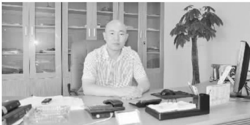
□记者 戚团结 文/图

周口铭阳汽车销售服务有限公司成立于2009年1月,是长安福特授权认证的河南省周口市4S品牌经销商。公司位于市区中州大道与太昊路交汇处,注册资金500万元,占地16000平方米,经营范围涵盖了嘉年华、福克斯、蒙迪欧、S-MAX等福特品牌系列车型。福特品牌是集整车销售、维修服务、配件供应、信息反馈、二手车置换、车辆分期付款、保险上牌于一体的4S经销商。