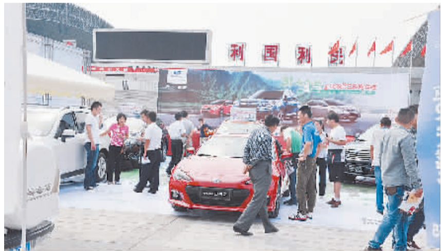
汽车展厅人头攒动