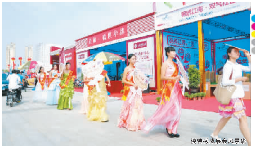
模特秀成展会风景线