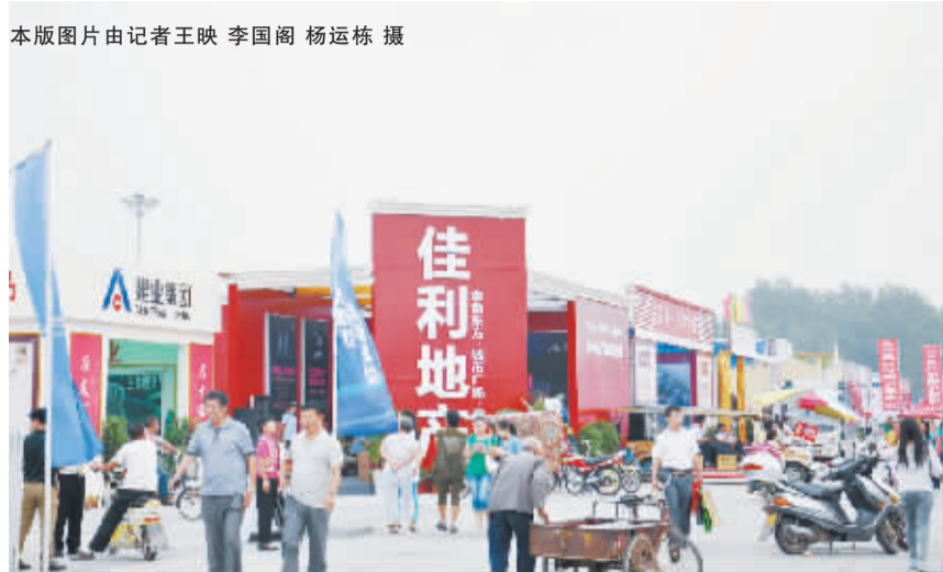
展厅精装提升展会品位