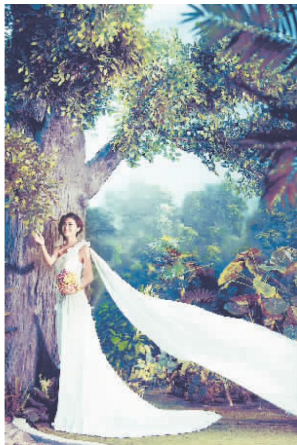
► 拍摄主题:美丽的微笑 拍摄地点:好莱坞影视城 拍摄时间:2013 年 9 月 5 日