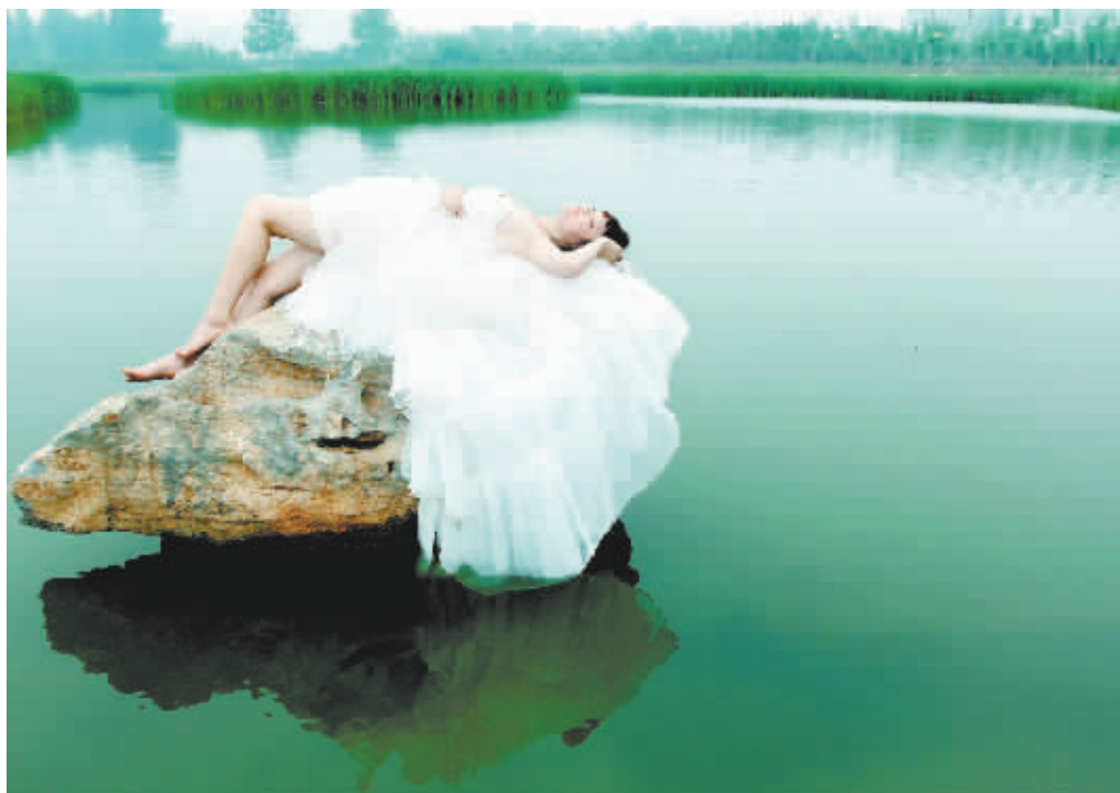
▲ 拍摄主题:湖中睡美人 拍摄地点:淮阳龙湖 拍摄时间:2013 年 9 月 5 日

周口报业传媒集团 周口市艺术摄影学会 主办 周口晚报 周口豫东集团好莱坞影视城 协办