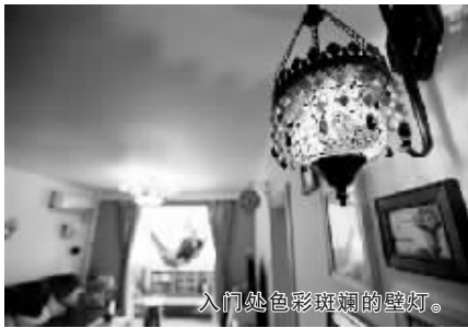
入门处色彩斑斓的壁灯。