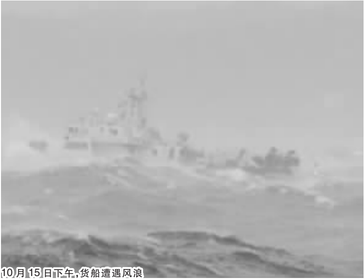
10月15日下午,货船遭遇风浪