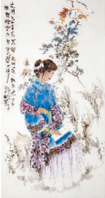
书中自有颜如玉 吴美英 作品