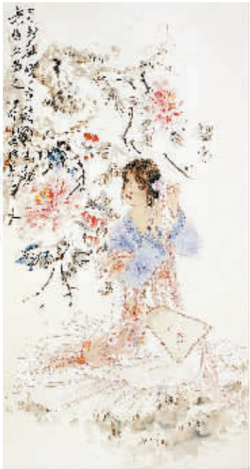
弄花香满衣 吴美英作品