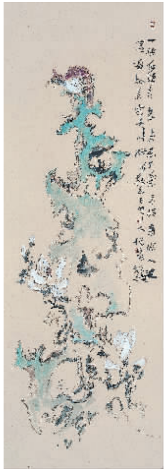
清歌一曲月如霜 邢玉生作品