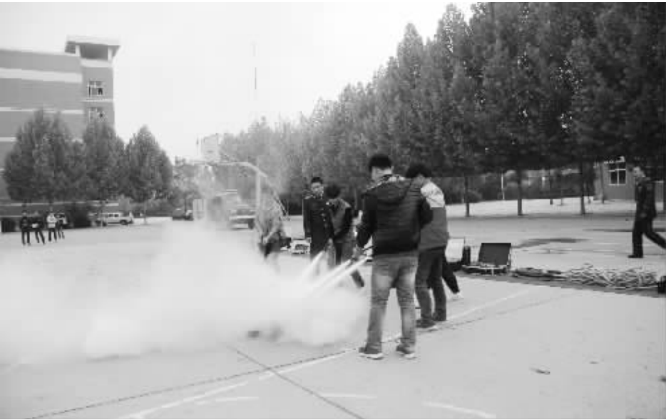
为进一步加强学校消防安全宣传教育工作,提升学校消防安全管理,增强学生消防安全意识和自防自救能力,近日,淮阳一高与淮阳县消防大队在该校开展灭火和疏散演练活动。

本报讯 近日，郸城三高开展了“教学能手”评选活动。活动为期 4 个月，期间，该校每个年级各学科每周都推选 3 位老师讲授公开课，教务处聘请具有丰富经验的老教师担任评委，依据“高效课堂”考核程序，结合平时小组学习记录、学科课堂记录、学生成绩表等基本信息，全面考量，评选出“高效课