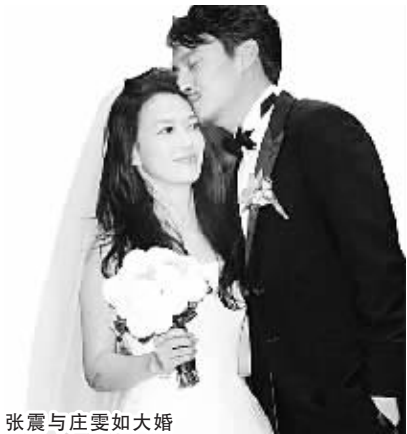
张震与庄雯如大婚

本报综合消息 11月18日晚,台湾影星张震和女友庄雯如在台北举办结婚派对。下午在牵着娇妻和媒体见面时,张震甜蜜地说道:“生小孩没有计划,越快越好”。当晚的婚宴大腕云集,李安、王家卫、侯孝贤、梁朝伟、刘嘉玲夫妇、绯闻女友舒淇等参加,被赞赶超