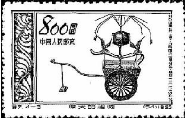
我国特种邮票里的记里鼓车

现代的交通工具,无论是海陆的汽车、火车和轮船,还是空中的飞机,均设有显示速度表和里程表。而事实上,这些速度和里程装置,早在 1600 年前我国就开始使用了。