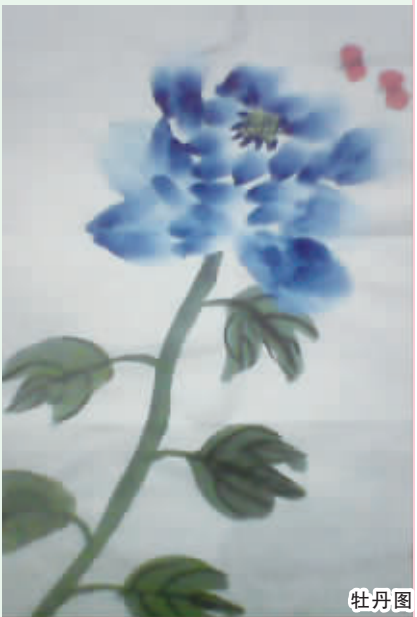
牡丹图 周口六一路小学六(7)班 刘明晓 编号:131347