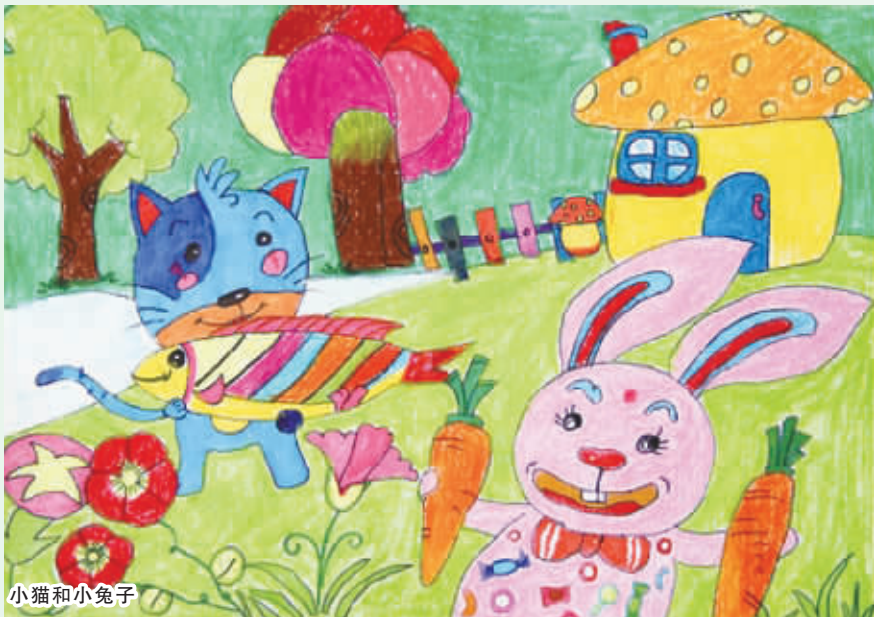
小猫和小兔子 周口七一路二小五(1)班 王淇 编号:130608