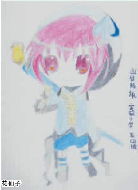
花仙子 周口实验小学五(2)班 崔师航 编号:131871

翰墨留香 本栏目刊发小记者的书法、绘画、摄影等作品。小记者们,如果你有些爱好,快快拿起手中的笔开始创作吧!作品创作完成后,请用相机拍下来发送到 zkwbxjz@126.com