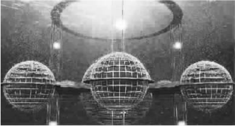
“水下城市”形成一个“次生物圈”