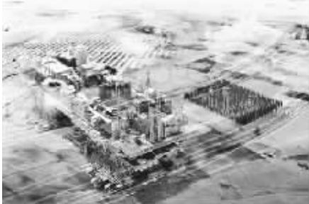
主要靠太阳能供电的移动城市

移动城市在未来很可能会成为一种潮流，但这其实是人们应对环境变化的无奈之举。如果我们不想如同吉卜赛人那样四处流浪，如果我们不想如同候鸟那样每年都要忍