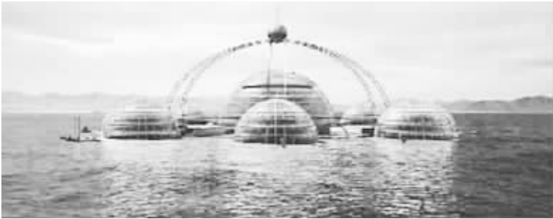
科幻般的“生物圈二号”