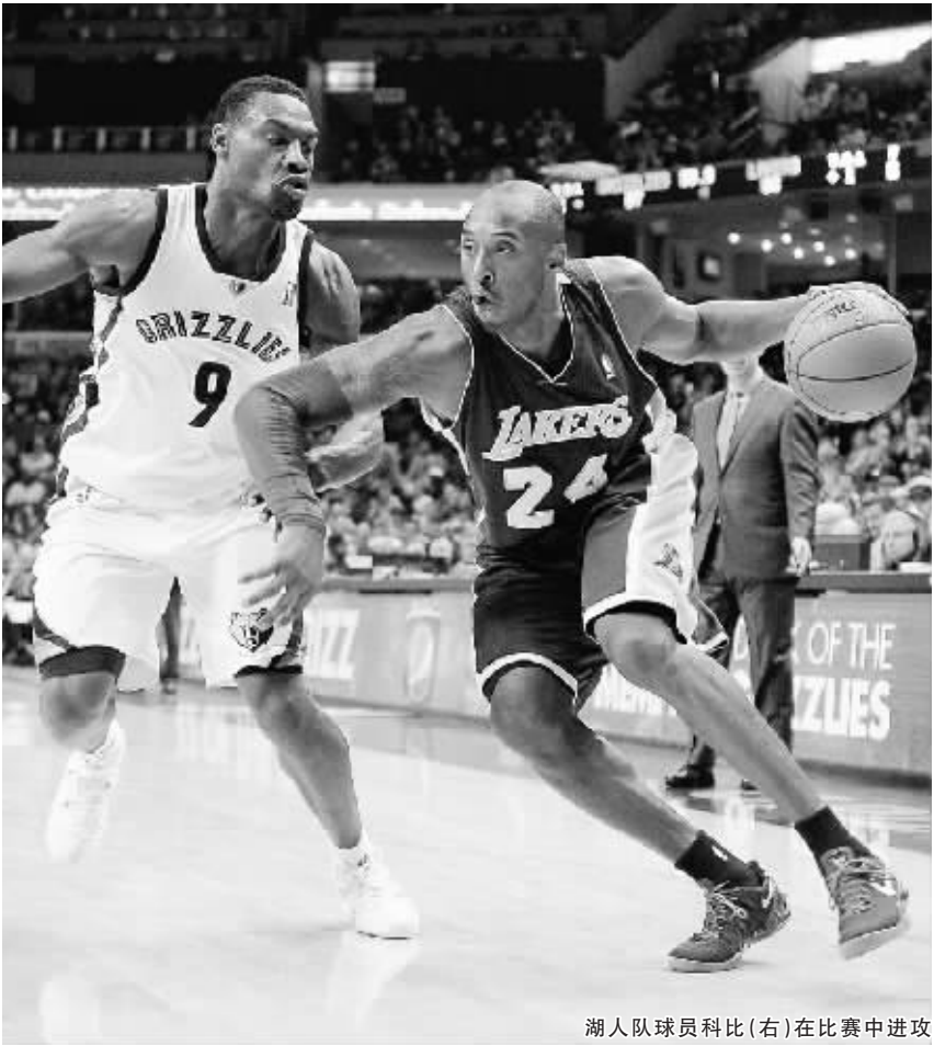
湖人队球员科比(右)在比赛中进攻

还有 56 秒时，尼克·杨连投带罚拿下 3 分，湖人以 34:19 领先。卡拉瑟斯还以一记三分，一人连得 5 分后，灰熊将比分追成 24:34。 科比逐渐找回昔日的感觉。第二节将过半时，他又一次背打，转身之后跳起，有个明显的滞空动作，拉杆投篮命中，湖人仍以 43:37 领先。米勒还以一记三分，戴维斯也罚中一球，灰熊只以 41:43 落后。米克斯也为湖人投中三分，科比此后两罚两中，然后助攻加索尔，湖人连得 7 分，以 50:41 再度拉开差距。半场结束时，湖人以 52:47 领先。 第三节湖人命中率下降，灰熊在本节将过半时以 57:56 反超。科比中投还以一球，约翰逊也上篮得手，湖人重新取得领先。本节还有 6 分 02 秒时，米克斯抢断得手，湖人发起快攻，加索尔在前场接球后轻松上篮，湖人以 62:57 领先。本节最后 4 分钟，湖人未能投中一球，灰熊打出一波 8:1 后，将比分追成了 67 平。 最后一节的争夺更为激烈。终场前 3 分钟，阿伦突破上篮得手，灰熊只以 85:88 落后。他还造成了犯规，但加罚不中。科比还以一记三分，湖人稳住阵脚。加索尔此后罚球命中，在比赛还有 23.8 秒时，湖人以 94:87 领先。灰熊虽然又将差距缩小到 5 分，但为时已晚。 (新体)