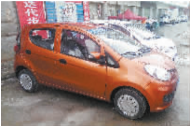
一销售点门前停放的老年代步车