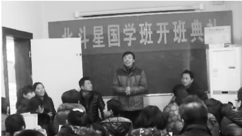
近日，北斗星英语学校举行国学班开班典礼，迈出了弘扬国学的第一步。

在对孩子进行教育的时候，一定要注意积累经验，从中找出最适合孩子的。只要帮助孩子养成了爱学习的习惯，那么学习便成为一种惯性。孩子越爱学习，他的学习能力就越强。（中教）