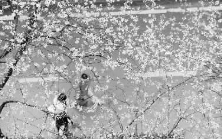
3 月 19 日，湖北武汉，在武汉大学樱花大道旁，成片的樱花树上已经长出了青色的花苞，少量绽放的樱花在春雨中显得美丽妖娆。