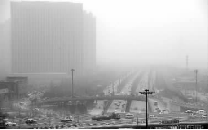
这是笼罩在扬尘之中的太原市滨河东路街景（3 月 19 日摄）。3 月 19 日，山西太原遭遇扬尘天气。据山西省气象台预报，山西大部分地区将迎 5 到 6 级、短时 7 级的西北风。