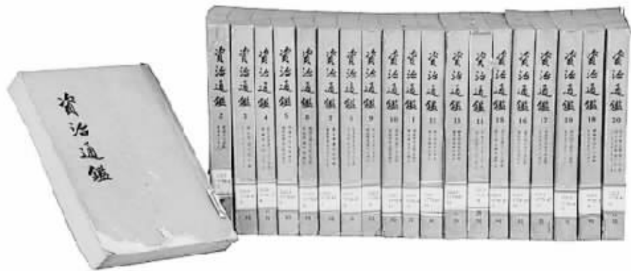
中华书局 1956 年版《资治通鉴》

这在当时引起了轰动,很多人认为“诏诸王改纳室,则大悖于人伦”。“此诏一出,天下何观!”然而,魏孝文帝照样实施“门第婚姻”,上行下效,在北魏形成了注重门第、以门品定官位的陋习,逐渐导致了北魏后期吏治的混乱腐败。