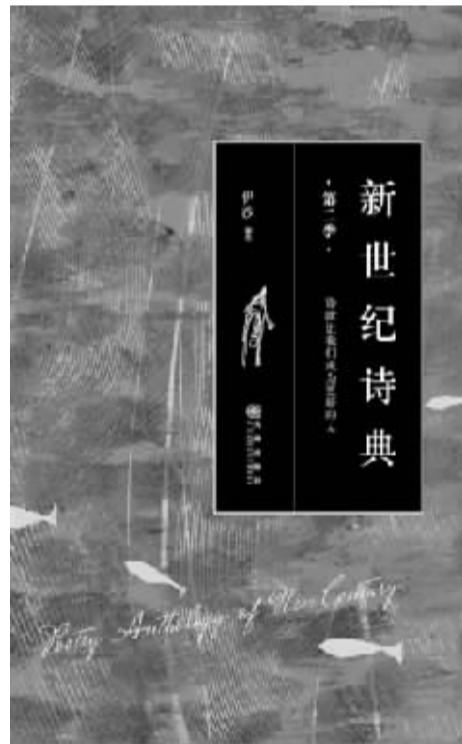
《新世纪诗典·第二季》伊沙 编选 九州出版社 2013年4月出版

我想的是如何不比第一年质量差。一年下来，我明白了：质量不会下降，就这么一路推下去，质量也不会下降！——中文现代诗发展状况之好，整体成就之高，比我2010年在衡山发表“初唐说”时所评估的更为乐观。那么我在此就将其修正为“中唐说”——是的，我们正走在通往“盛唐”的路上——正因为洞悉于此，我才愿将《新世纪诗典》进行到底。