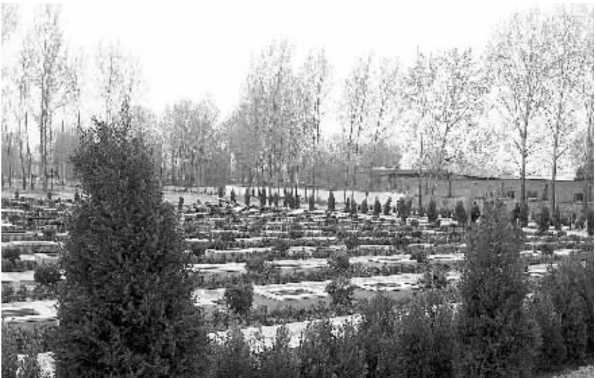
正在修建中的太康县烈士陵园

康县民政局相关负责人介绍，等陵园真正建好后，那些分布在全县各乡镇的烈士墓，将陆续搬迁到陵园中，进行统一管理维护，对于那些不适合迁移到陵园中的烈士墓，也将就地进行保护。 “太康县是革命老区，可一直没有一个烈士陵园，现在好了，太康县也建烈士陵园了，今后，我们对孩子进行爱国主义教育，又多了一个好的场所！”听说太康县正在建设烈士陵园的消息后，不少太康居民这样称赞。