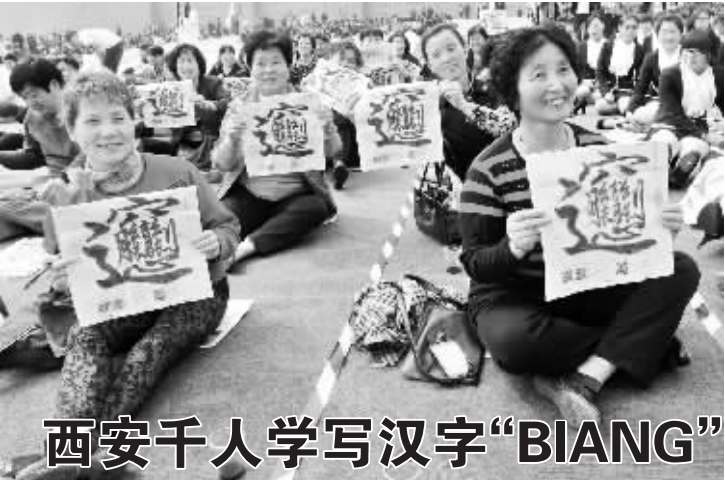
西安千人学写汉字“BIANG”