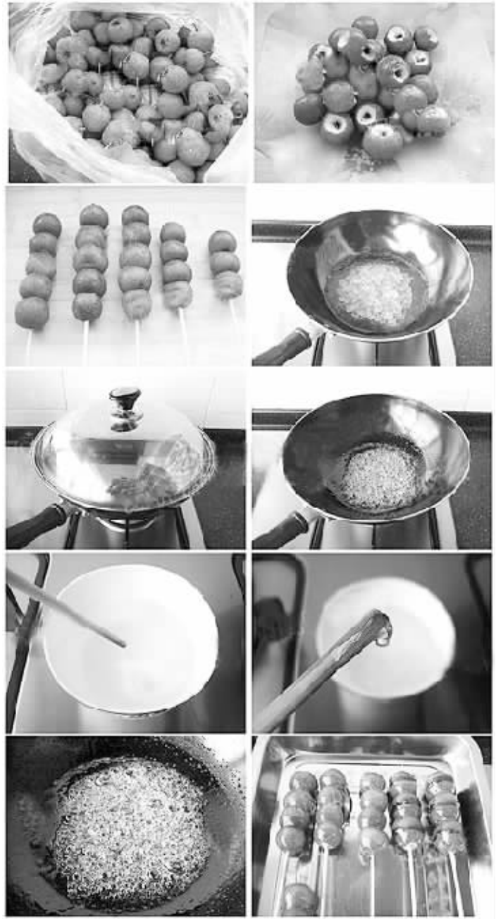
冰糖葫芦制作过程 资料图片