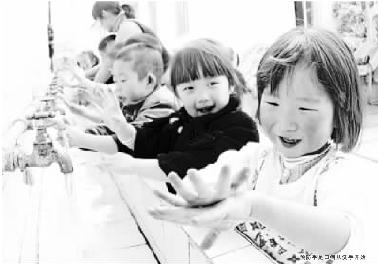
预防手足口病从洗手开始

少数重症病例(尤其是小于 3 岁者)病情进展迅速,表现:高热、精神差、嗜睡、易惊、头痛、呕吐、谵妄甚至昏迷;肢体抖动,肌阵挛、眼球震颤、共济失调、眼球运动障碍;无力或急性弛缓性麻痹;惊厥。呼吸浅促、呼吸困难或节律改变,口唇发绀,咳嗽,咳白色、粉红色或血性泡沫样痰液;面色苍灰、皮肤花纹、四肢发凉,指(趾)