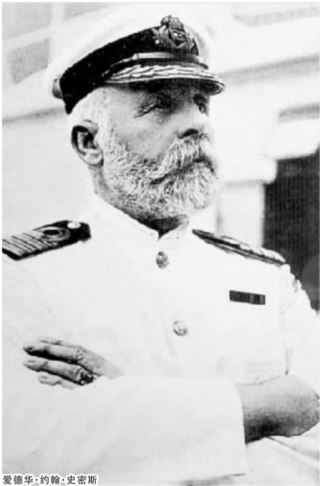
爱德华·约翰·史密斯

近两天,弃船逃生的韩国“岁月”号客轮船长成了舆论炮轰的对象。这一幕让很多人想起“泰坦尼克”号船长爱德华·约翰·史密斯,他下令让妇女和儿童先走,最后和船只一起葬身海底。在西方漫长的航海历史上,被尊为船长的人,所承担的责任和受到的尊敬,远远要超过其他任何头衔。船长通常以他丰富的水上经验、过人的领导能力和坚韧的毅力而得以任命。在遇到海难和战争的时候,船长永远要运用他的能力,最大限度地保证属下人员安全,让船只遭受最小损失。近代海事历史学者指出,坚守岗位、将乘客利益放在第一位的船长要远多于那些弃乘客于不顾的船长。