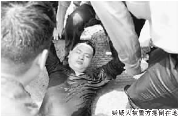
嫌疑人被警方,摁倒在地

事件发生后,所有伤员均被及时安排到福州市区 4 家医院进行抢救治疗。目前,救治善后工作正有条不紊地进行中。