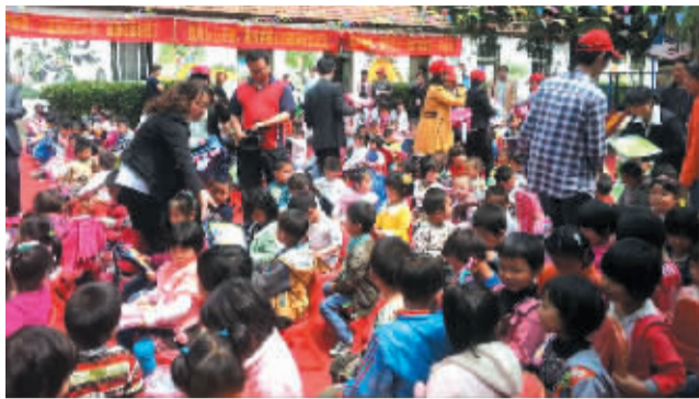
图为太平洋寿险公司参加的《“爱”在项城》为主题关爱留守儿童公益活动现场。