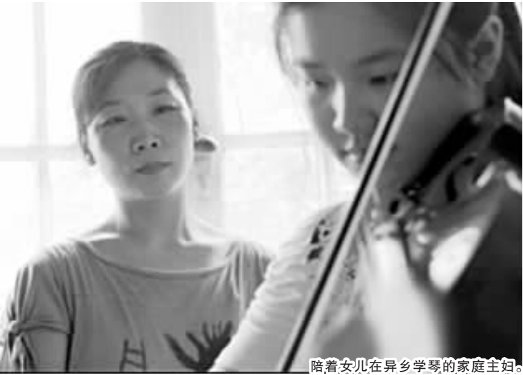
陪着女儿在异乡学琴的家庭主妇。

辛酸史吧?家人团聚才是家庭最大的幸福,但学琴小姑娘的家是为了学琴夫妻分离不相见、家中长辈癌症化疗不相见,一切只为女儿出人头地。完全是这个主题的反面。看完简直没食欲,太可怕了!”