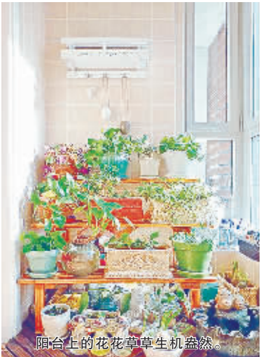
阳台上的花花草草生机盎然。