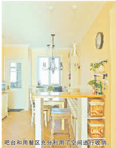
吧台和用餐区充分利用了空间进行收纳。