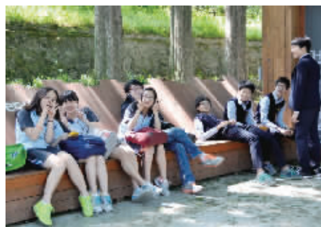
快乐游园的韩国学生。