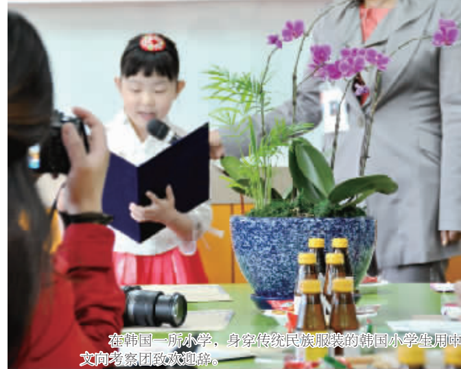
在韩国一所小学,身穿传统民族服装的韩国小学生用中文向考察团致欢迎辞。