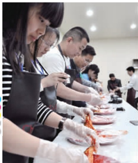
学做韩国传统泡菜。