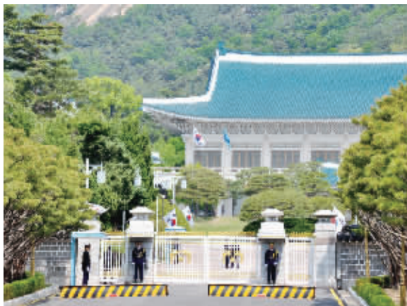
韩国首尔总统官邸——青瓦台。