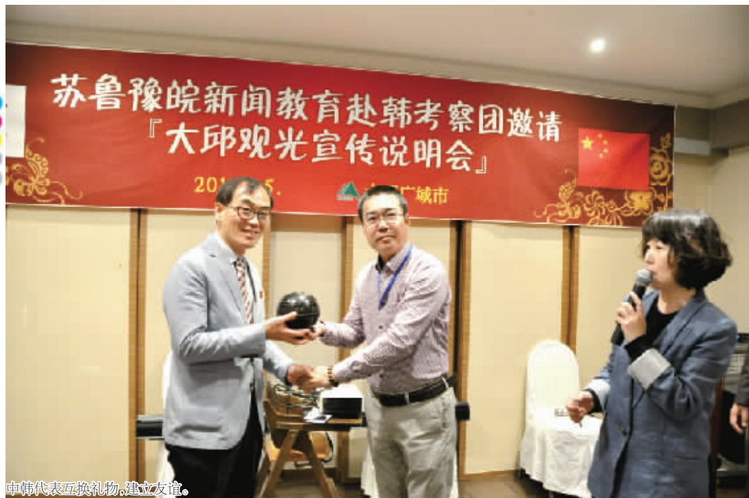
中韩代表互换礼物,建立友谊。