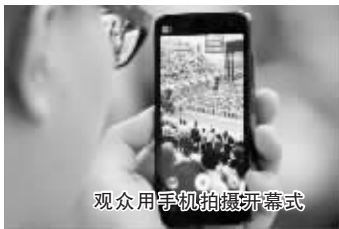
观众用手机拍摄开幕式